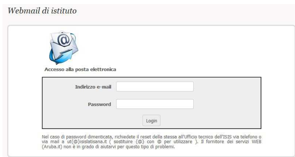
Fig. 2 – Inserimento dei dati di accesso

Sarete rimandati ad una pagina dove vi verrà richiesto l'inserimento dell'indirizzo e-mail e della password che vi sono stati consegnati (Fig. 2). Al termine dell'operazione, cliccate su "Login" per confermare.